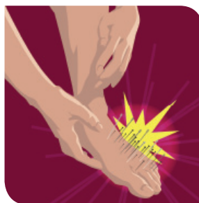
Slika 3. Osjet "žarenja" i "peckanja"